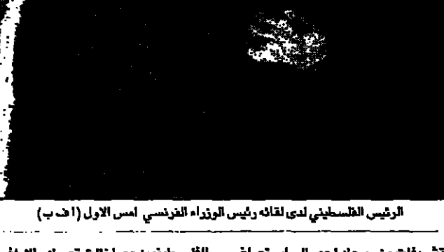
الرئيس الفلسطيني ياسر عرفات